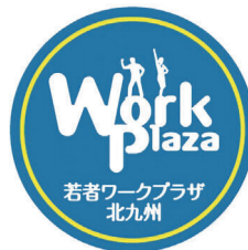
若者ワークプラザ 北九州